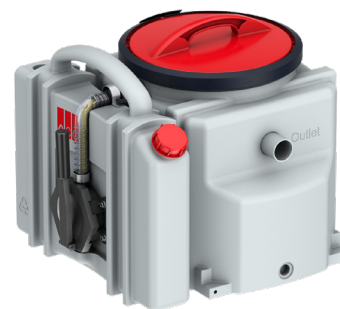
Parempoolse rasvakogujaga (3700.04.10)